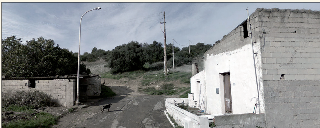
Dall'alto: l'ex Lido Iride di Platamona (SS), Teti e Masainas.