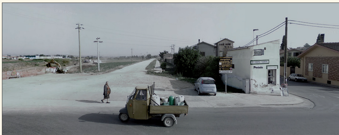
Dall'alto: Teulada, Ollolai, e Samassi.